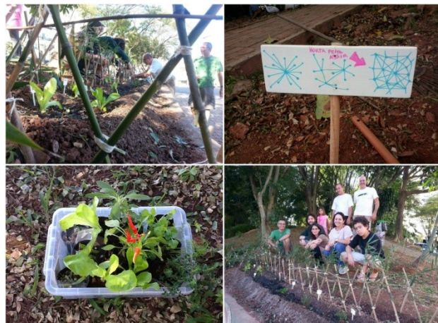
Horta da Vila Indiana