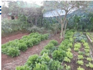
ESCOLA ADOLFO CASAIS MONTEIRO SP