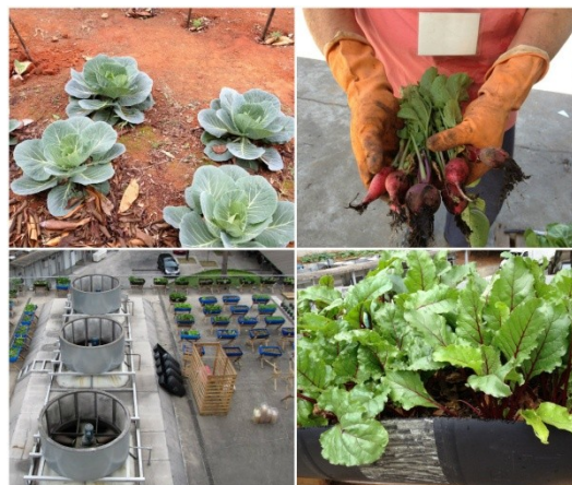
Horta da FMUSP