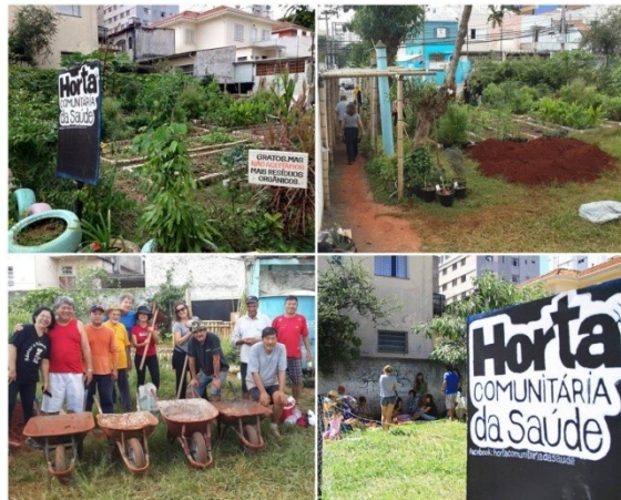
Horta da Saúde