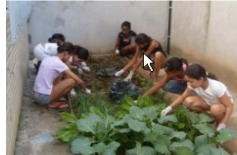
Casa do Adolescente de