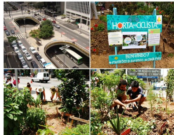
Horta do Ciclista