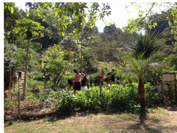
Horta das Corujas