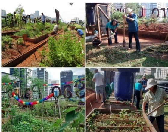
Horta do Centro Cultural SP